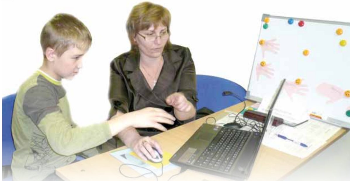
Развивающие и обучающие компьютерные игры дают большие возможности для осуществления развития детей с особыми образовательными потребностями

Кому небезразлично образование и развитие детей, имеющих ограничения по здоровью, и те, от кого зависит пре-