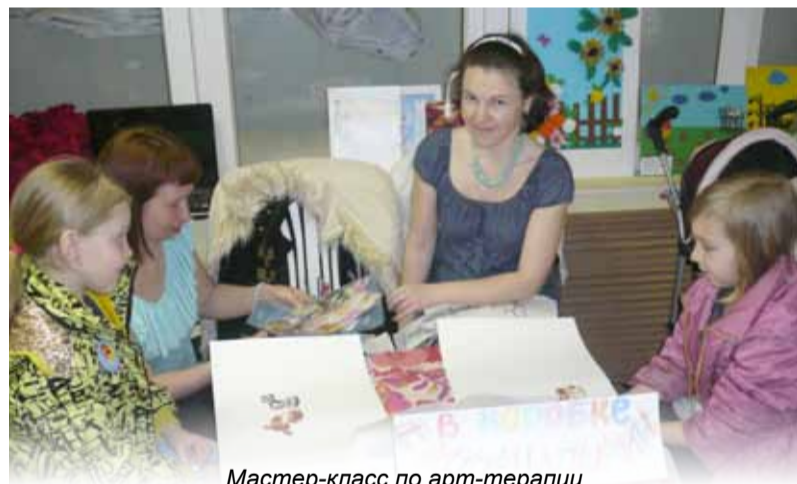
Мастер-класс по арт-терапии

За два часа плотного общения со специалистами родители смогли ознакомиться с образовательными услугами, предоставляемыми в Перми для детей, имеющих ограничения по здоровью, получить консультацию специалистов, провести экспресс-диагностику и комплексное обследование ребенка, сразу определив индивидуальный план работы с ребенком, а также приобрести специальную и детскую литературу.