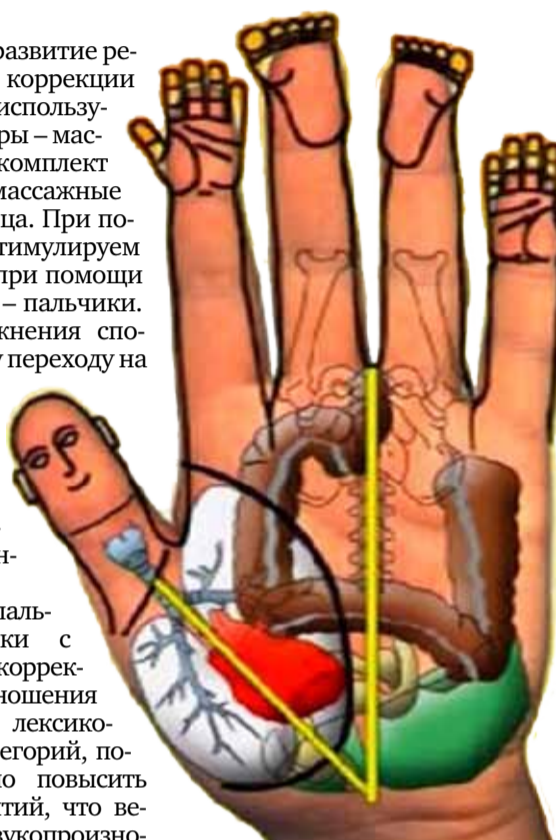
Су-джок-массажеры активизируют работу всех органов.

Такое сочетание пальчиковой гимнастики с упражнениями по коррекции звукопроизношения и формированию лексико-грамматических категорий, позволяет значительно повысить эффективность занятий, что ведет к коррекции звукопроизношения, развитию фонематического слуха, развитию лексико-грамматических категорий, совершенствованию навыков пространственной ориентации, ориентированию ребенка в частях тела (умения определять, где