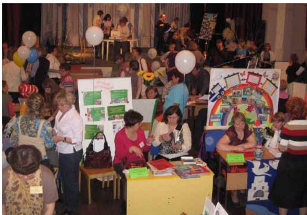
На ярмарке свои услуги представили около пятидесяти учреждений.

В рамках ярмарки был проведен круглый стол «Профессиональная ориентация и обучение детей с ограниченными возможностями здоровья с учетом особенностей рынка труда города Перми». В работе круглого стола приняли участие директора специальных коррекционных образовательных учреждений города, руководители профессиональных училищ и техникумов, представители центра занятости населения г. Перми, руководители крупных предприятий города, являющиеся потенциальными работодателями, а также родители детей-инвалидов. В рабочем режиме обсуждался спектр вопросов, способствующих успешной профессиональной ориентации, про-